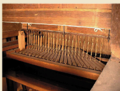
Vue arrière de la traction mécanique du Clavier d'Echo

Les 2 Buffets sont en chêne mouluré. Le Positif, situé en bas, est une représentation à l'identique du Grand-Orgue, ce qui donne un effet très harmonieux. Sur les côtés du Grand-orgue, des sculptures ornementales représentent 2 putti faisant un signe de la main.